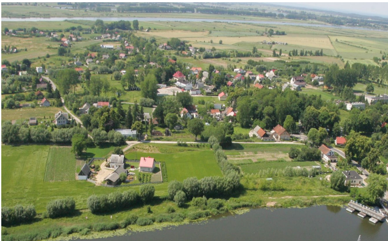
Fot.1. Drewnica – „lotu ptaka”

Układ przestrzenny wsi jest pierwotny, ale nieznanego pochodzenia. Obecnie wieś jest wielodrożna, z cmentarzem zamienionym na park w północno wschodniej części wsi.