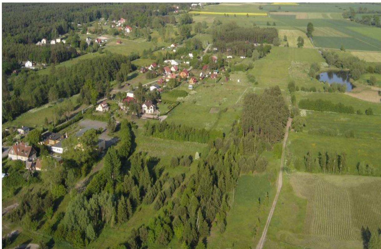
Fot.1. Junoszyno – „z lotu ptaka”

W strukturze demograficznej wsi jest wyraźna przewaga mężczyzn (204 osób) nad kobietami (184 osób). W 2007r. we wsi urodziły się 3 osoby, zmarły 4 osoby.