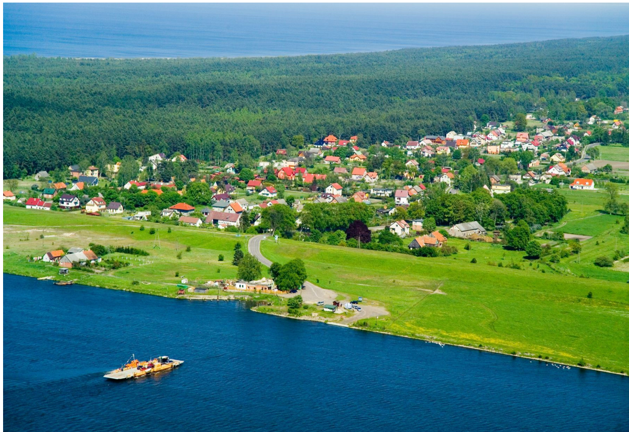
Fot.1. Mikoszewo – „z lotu ptaka”

Tak jak inne miejscowości położone na Mierzei Wiślanej w przestrzeni wsi widoczny jest układ pasmowy. Od północy bezpośrednio sąsiaduje morzem, następnie występuje zwarty kompleks leśny, a zanim zwarta zabudowa. W południowej części wsi występują użytki rolne związane z już z Żuławami Wiślinami.