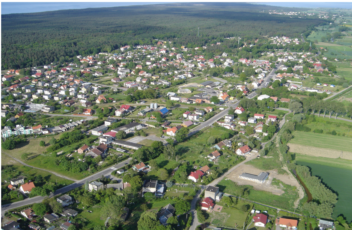
Fot.1. Stegna – „z lotu ptaka”

współczesna zabudowa mieszkalno – pensjonatowa o różnorodnej stylistycznie architekturze, z rzadka jednak przekraczającej wysokość 2-3 kondygnacji.