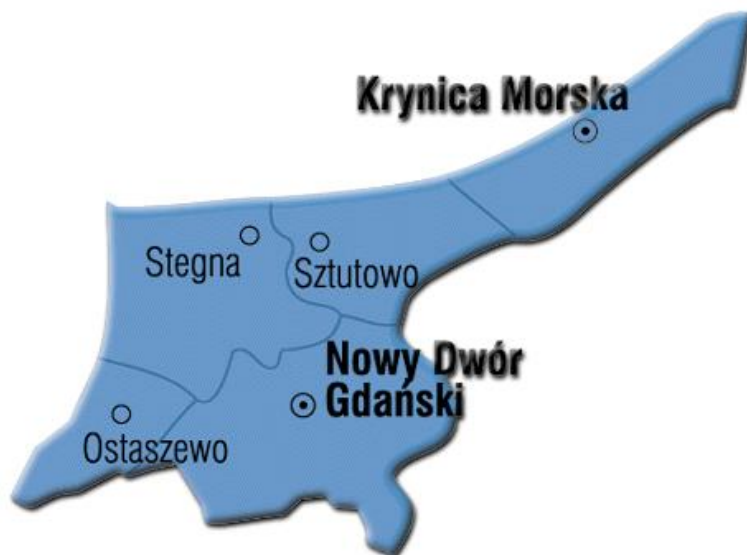
Rysunek 1. Położenie Gminy Stegna na terenie Powiatu Nowodworskiego