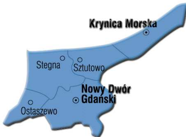
Rysunek 1. Położenie Gminy Stegna na terenie Powiatu Nowodworskiego