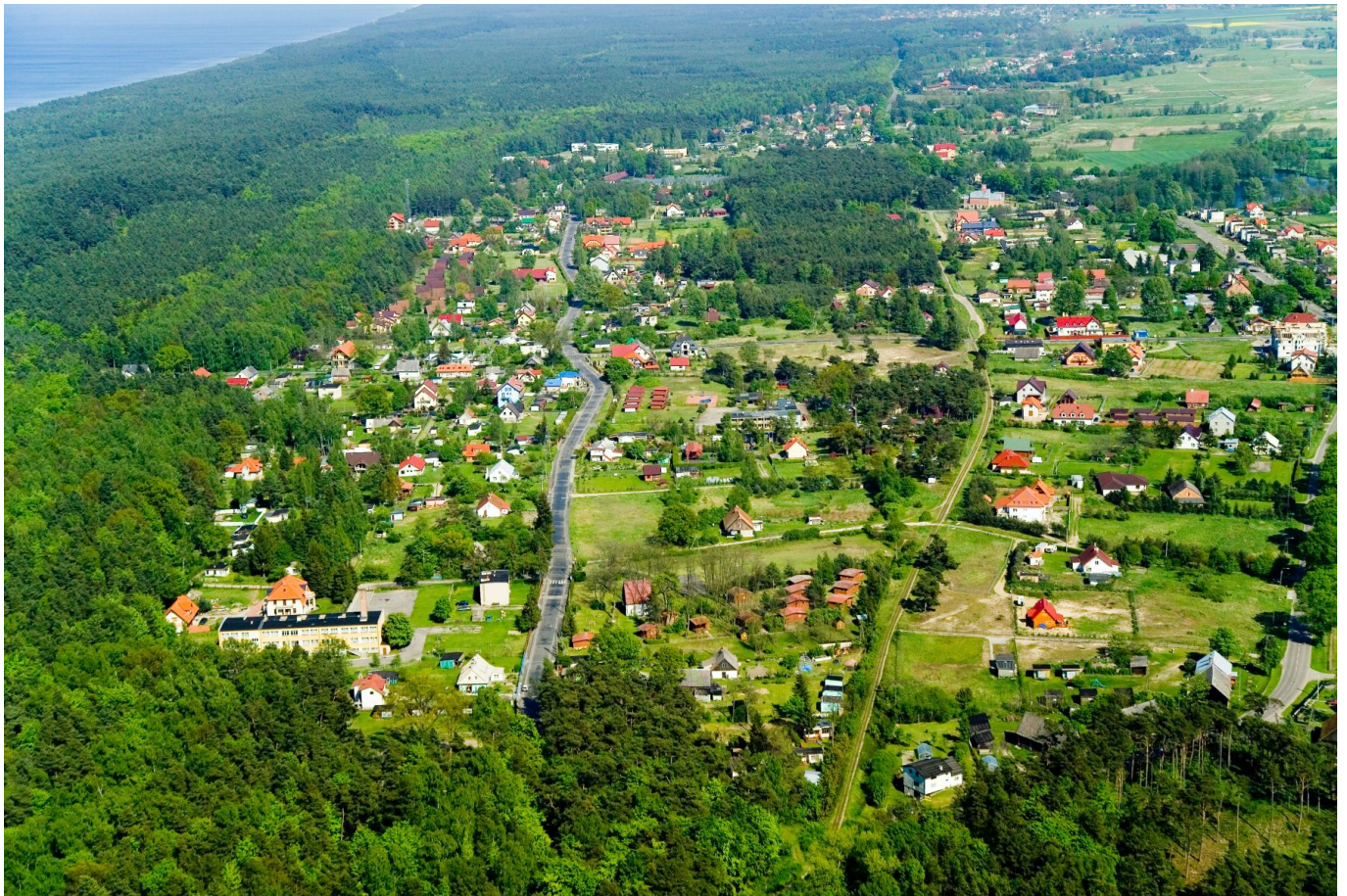
Fot.1. Jantar – „z lotu ptaka”