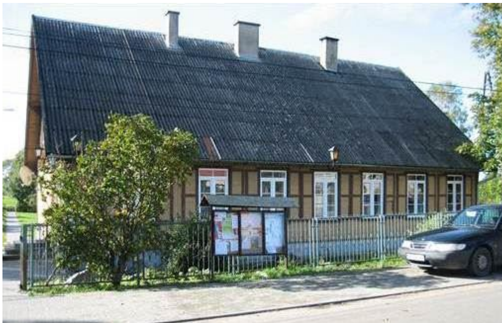
Fot.3. Budynek świetlicy wiejskiej w Tujsku

Udział w spotkaniach, imprezach, szkoleniach przyczynia się do nawiązywania nowych kontaktów i utrwalania istniejących. Przyczynia się do większej integracji, stymuluje aktywność mieszkańców, którzy w grupie wykazują o wiele więcej inicjatywy do działań społecznych.