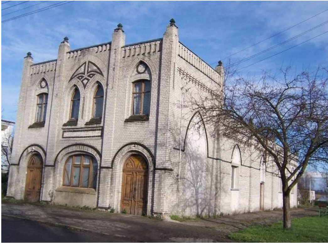
Fot.2. Dawny kościół baptystów