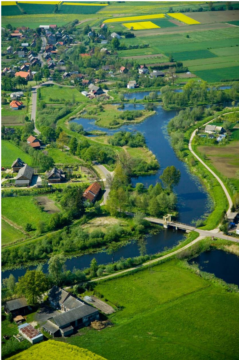
Fot.1. Most w Tujsku „z lotu ptaka”