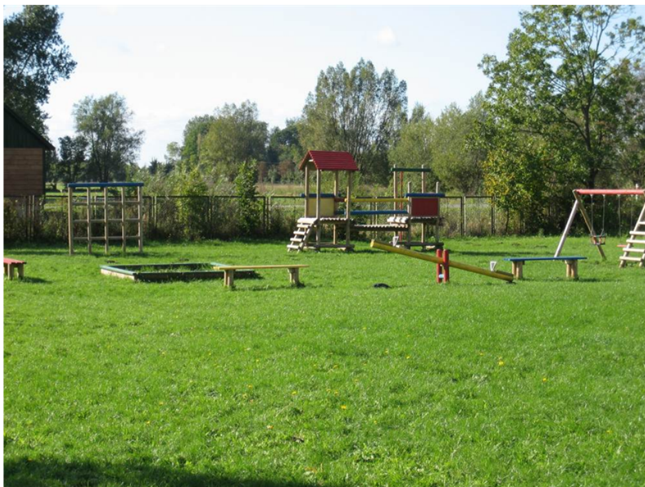
Fot.4. Plac zabaw znajdujący się za budynkiem świetlicy wiejskiej