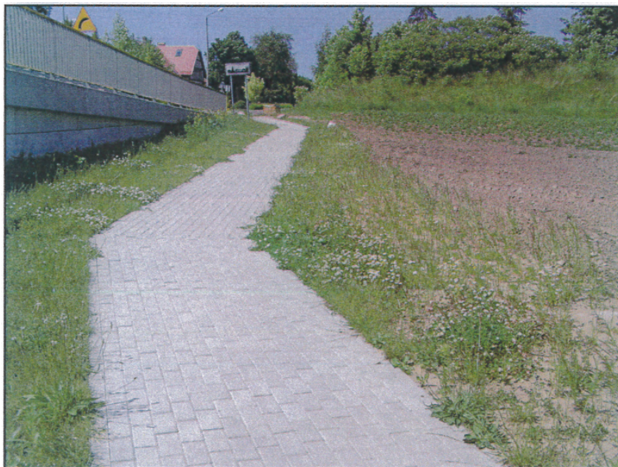
Widok działki od strony południowej.