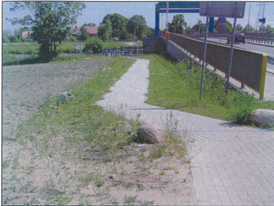
Widok ogólny działki od strony północnej.