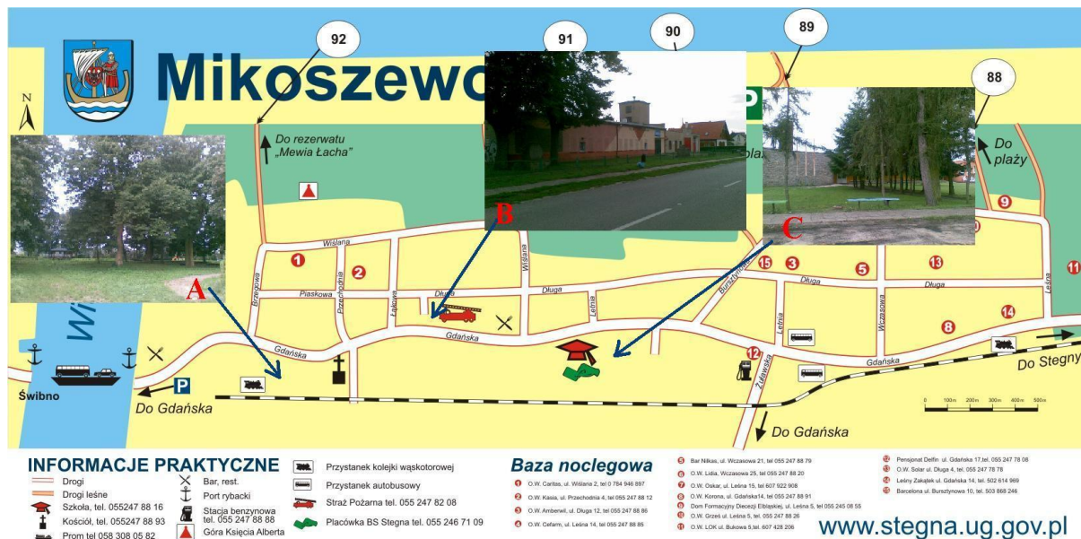
Rys.2. Obszary o szczególnym znaczeniu dla zaspokojenia potrzeb mieszkańców Mikoszewa

W miejscowości Mikoszewo można wyróżnić kilka obszarów o szczególnym znaczeniu dla zaspokojenia potrzeb mieszkańców, sprzyjających nawiązywaniu kontaktów społecznych, ze względu na położenie oraz cechy funkcjonalno-przestrzenne. Obszary te oznaczone literami A,B,C pokazano na rys. 2.