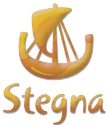
Wersja przestrzenna kolorowa