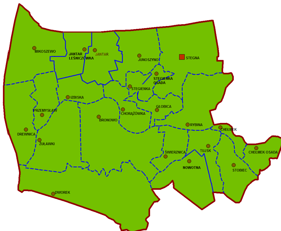
Rys. 1. Położenie sołectwa Dworek-Niedźwiedzica na tle gminy Stegna

Krajobraz kulturowy sołectwa jest częściowo zachowany, tylko we wschodniej części zniszczony poprzez zabudowę po byłym Państwowym Gospodarstwie Rolnym. Występująca zabudowa powstała w końcu XIX w i pocz. XX w. Powyższy układ tworzą zachowany nadal czytelny układ rowów melioracyjnych i polderów, zagrody holenderskie, drewniane domy z XIX w murowane domy z 1 ćw. XX w oraz dwór z pocz. XX w, parki przydomowe, aleja przydrożna oraz kilak szpalerów śródpolnych.