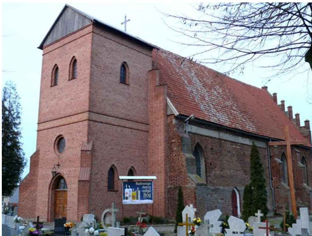
Fot.1. Kościół gotycki z XIV w pw. Św. Jakuba Apostoła w miejscowości Niedźwiedzica