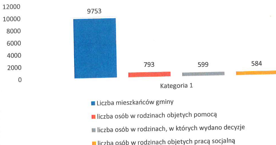
Tabela 1. Rzeczywista liczba rodzin i osób objętych pomocą społeczną